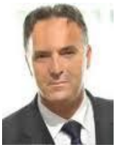
Shkruan: Xhenc Bezhi